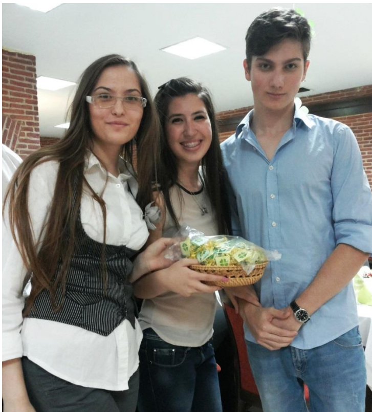
Организираме самостоятелно и активно се включваме в благотворителни събития