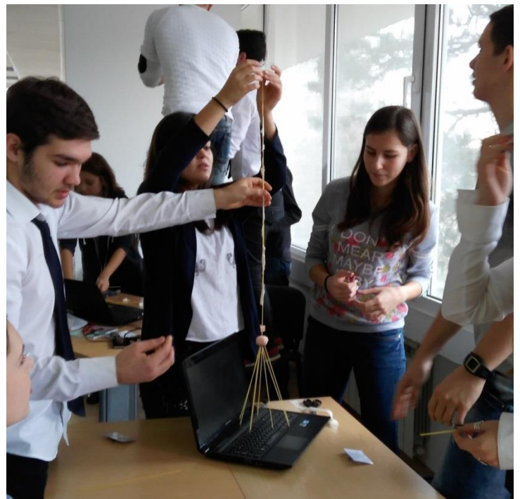
Участваме в иновационни лагери