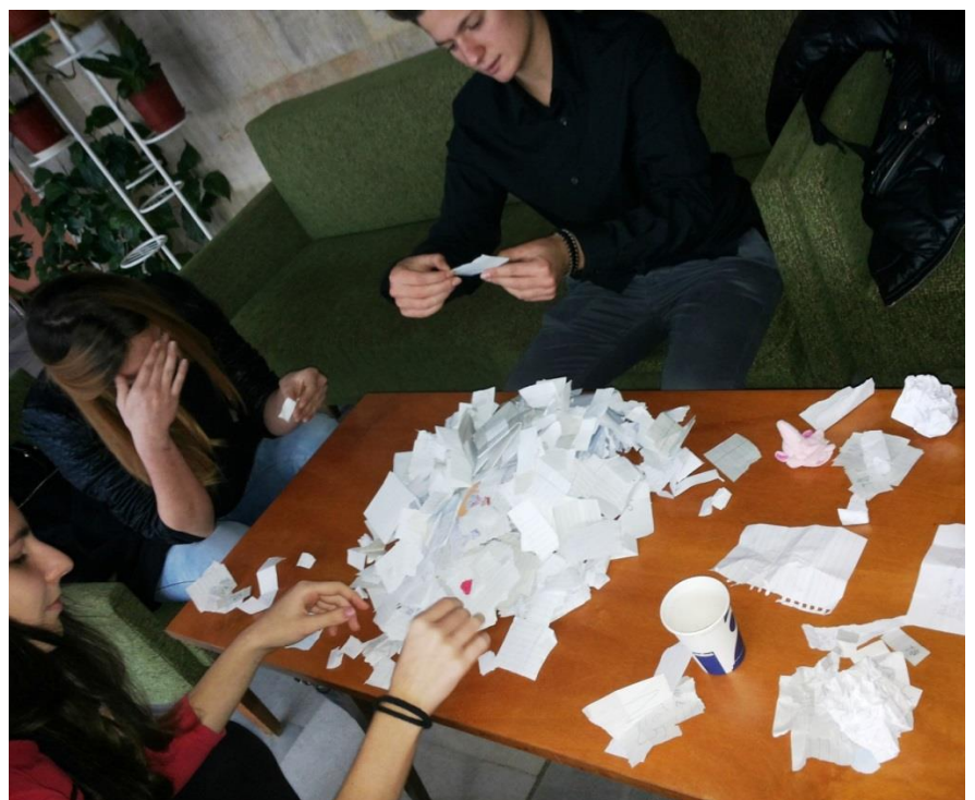
След преброяване на демократичния вот, обявяваме победителите и раздаваме наградите