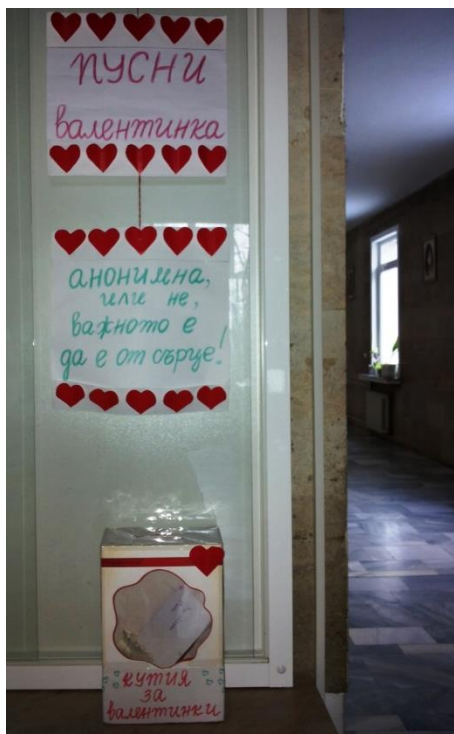
Обичаме да общуваме помежду си (особено през февруари)