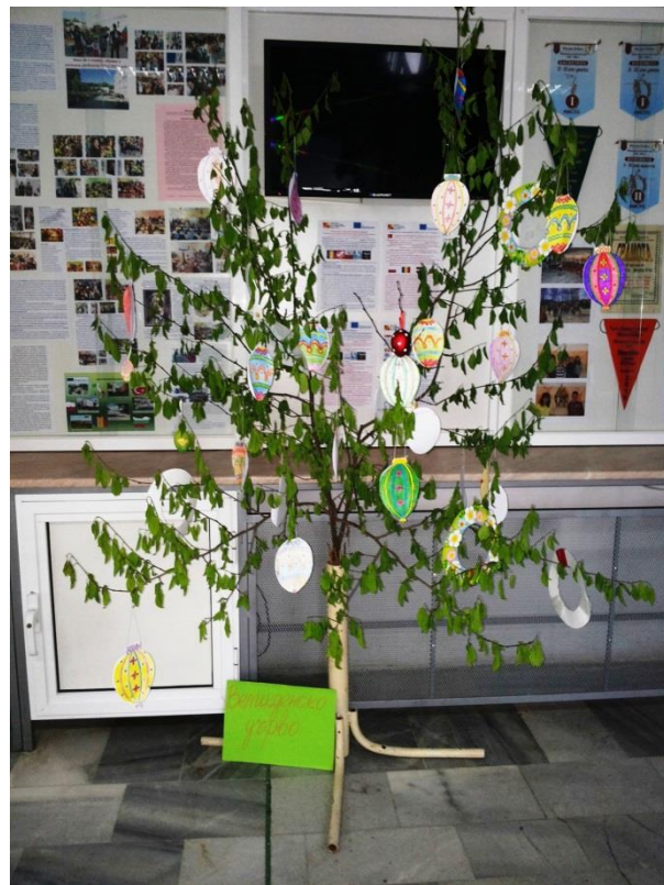
Заедно украсяваме и посрещаме с много настроение празниците

⇒ Разглеждане и прилагане на интересни успешни модели и практики от Европа и света, свързани с подобряването и разведряването на училищния живот и образователния процес;